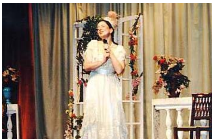
"La Vedova Allegra" F. Lehar

DAL 1984 ESPERIENZA LAVORATIVA COME SEGRETARIA, PUBBLICHE RELAZIONI, UFF. COMMERCIALE/ESTERO, UFF. ACQUISTI E UFF. TECNICO. OTTIMA CONOSCENZA ED USO DI PC E SISTEMI.